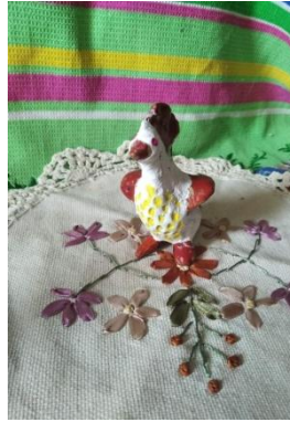
фото 11 Петушок