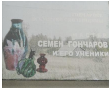
фото 14 Выставка 2005 г.