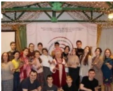
фото 16 Фестиваль