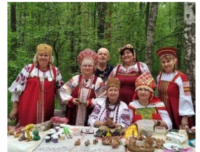
фото 15 «Славянское братство»