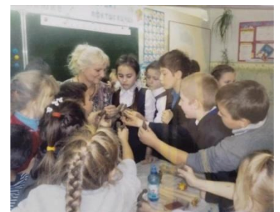
фото 21 СШ № 36