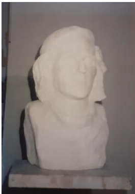
фото 13 Гипсовый бюст