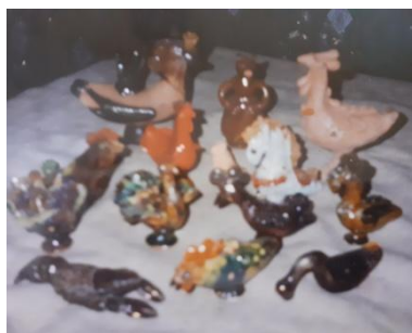
фото 2 Игрушки С.Б. Гончарова