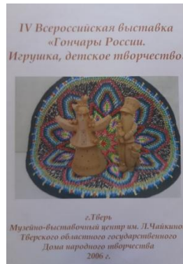
фото 17 Выставка г. Тверь