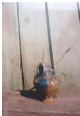
фото 8 Соловей