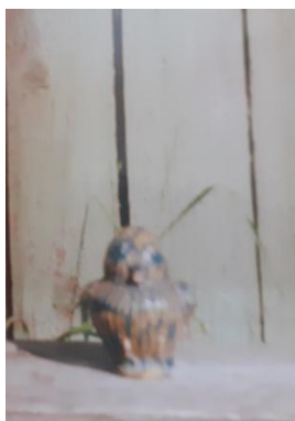
фото 7 Соловей