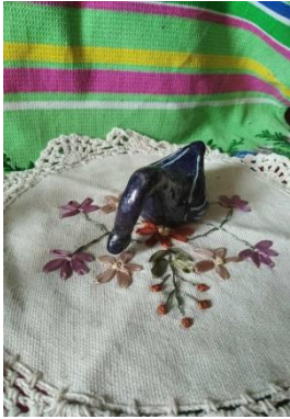
фото 10 Лебедь