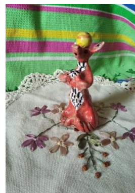
фото 9 Лиса с коlobком