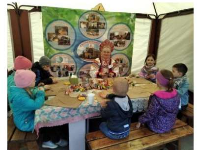
фото 18 Дом для мамы