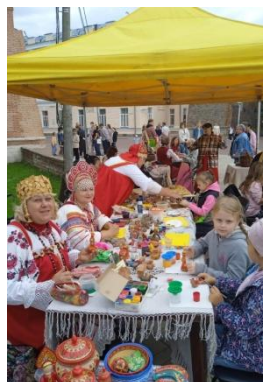
фото 20 Мастер-класс